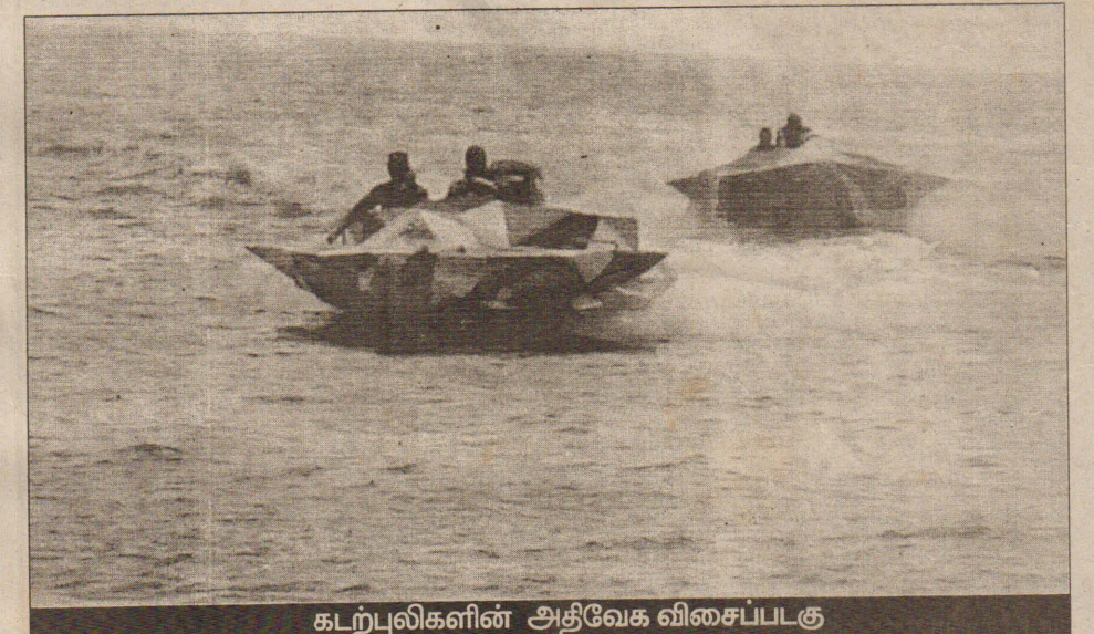
கடற்புலிகளின் அதிவேக விசைப்படகு

இதனிடையே நீர்மூழ்கிப் படகின் தாக்குதலையும் நிராகரிக்க முடியாது என கடற்படை அதிகாரி ஒருவர் தெரிவித்துள்ளார். விடுதலைப்புலிகளை பொறுத்தவரையில் ஒரு முழுத்தேசத்திற்குரிய படைக்கட்டுமானங்களை வடிவமைப்பதிலும், அதிர்ச்சியான தாக்குதல்களை நடத்துவதற்கு ஏதுவாக படைக்கலங்களையும், தாக்குதல் உத்திகளையும் வடிவமைப்பதிலும் ஒருபோதும் பின்நிற்றதில்லை.