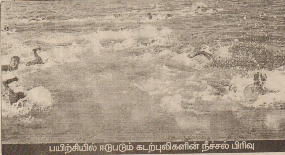
பயிற்சியில் ஈடுபடும் கடற்புலிகளின் நீச்சல் பிரிவு

நடைபெற்றுவரும் போரினால் ஏற்கனவே இலங்கை அரசின் பொருளாதாரம் மிகவும் பாதிக்கப்பட்டதை அடைந்துள்ளது. மக்களின் வாழ்க்கைச் செலவு 22 சதவீதத்தை அண்மித்துவரும் இந்த நிலையில் புதிதாக திறக்கப்படும் களமுனைகளும் புதிய தாக்குதல் உத்திகளும் யாரும் எதிர்பார்க்காத திசையில் போரை நகர்த்த போகின்றது என்பது மட்டும் யதார்த்தமானது. நன்றி வீரகேசரி