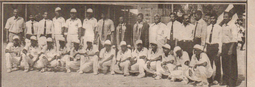
கொக்குவில் இந்துக் கல்லூரி, யாழ்.இந்துக் கல்லூரிகளுக்கிடையிலான மாபெரும் துடுப்பாட்டப்போர் நேற்றைய தினம் கொக்குவில் இந்துக் கல்லூரி மைதானத்தில் நடைபெற்றபோது, விருந்தினர்கள் இரு கல்லூரிகளினதும் பாண்ட் வாத்தியத்துடன் அழைத்து வரப்படுவதையும் துடுப்பாட்ட அணி வீரர்களையும் படங்களில் காணலாம்.