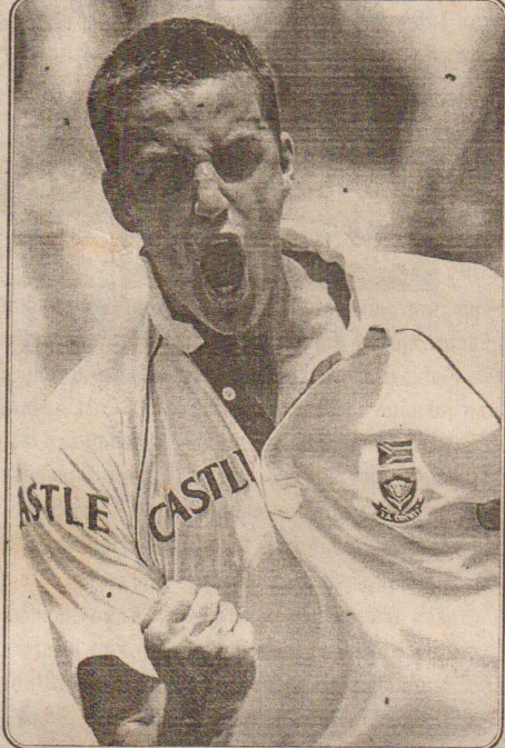
மற்றும் மோர்கல் 2 விக் கெட்டுக்களையும் வீழ்த்தினார்.

வெற்றிபெற்று முதலிடுபெடுத்தாடிய இந்திய அணி அதன் முதல் இன்னிங்ஸில் 76 ஓட்டங்களை மாத்திரம் எடுத்து சகல விக் கெட்டுக்களையும் இழந்தது. இதில் அதிக பட்சமாக இர்பான் பதான் ஆட்டமிழக்காமல் 21 ஓட்டங்களையும் தோனி 14 ஓட்டங்களையும் எடுத்தனர். பந்துவீச்சில் ஸ்ரையன் 5 விக் கெட்டுக்களையும் நிறனி 3 விக் கெட்டுக்களையும்