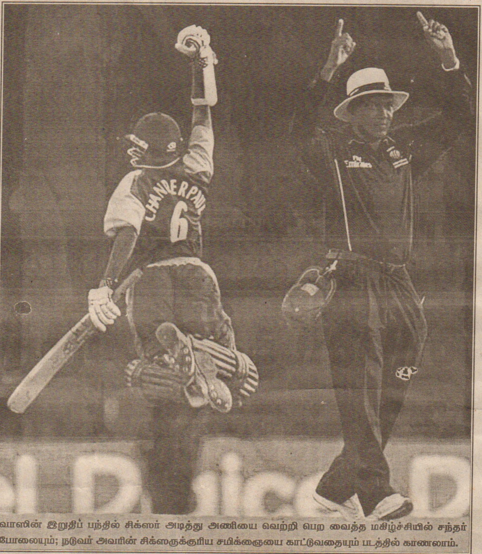
வாளின் இறுதிப் பந்தில் சிக்ஸர் அடித்து அணியை வெற்றி பெற வைத்த மகிழ்ச்சியில் சந்தர்ப்போலையும்; நடுவர் அவரின் சிக்ஸருக்குரிய சமிக்ஞையை காட்டுவதையும் படத்தில் காணலாம்.

இரு அணிகளுக்கும் இடையிலான இரண்டாவது ஒருநாள் போட்டி இன்று போட் ஒப் ஸ்பெயினில் நடைபெறுகிறது. (5)