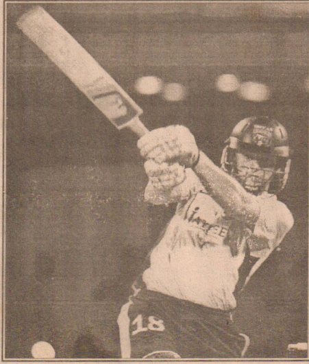
ஆட்டநாயகனாக அடம் கில்கிறீஸ்ட் தெரிவானார்.

இதல் ஆட்பரிழக்காமல் அடம் கில்கிறீஸ்ட் 48 பந்துகளில் (9 பவுண்டரிகள், 10 சிக்ஸர்கள் உட்பட) 109 ஓட்டங்களையும் வி.வி.எஸ். லக்ஸ்மன் 29 பந்துகளில் (5 பவுண்டரி உட்பட) 36 ஓட்டங்களையும் எடுத்தனர்.