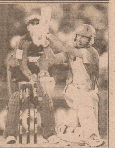
இதில் ஹடரிச் 52 பந்துகளில் (11 பவுண்டரிகள் ஒரு சிக்ஸர் உட்பட) 75 ஓட்டங்களையும் ஆட்டமிழக்காமல் யுவராஜ் சிங் 29 பந்துகளில் (3 பவுண்டரிகள் 2 சிக்ஸர்கள் உட்பட) 40 ஓட்டங்களும் எடுத்தனர்.

பதிலுக்கு 20 ஓவர்களில் 159 ஓட்டங்களை எடுத்தால் வெற்றி என்ற இலக்குடன் துடுப்பெடுத்தாடிய கிங்ஸ் லெவின் பஞ்சாய் அணி, ஹடரிச்சின் சிறப்பான ஆட்டத்தின் மூலம், 19.3 ஓவர்களில் 6 விக்ரெட்டுக்களை இழந்து 162 ஓட்டங்களை எடுத்து 4 விக்ரெட்டுக்களால் வெற்றி பெற்றது.