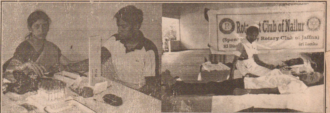
நல்லூர் நோட்டரக்ட் கழகத்தினால் யாழ்.போதனா வைத்தியசாலையின் இரத்த வங்கிக்கு 35-வது தடவையாக இரத்த தானம் செய்யப்பட்டது. இந்நிகழ்வில் இரத்த தானம் செய்யவுள்ளவரை வைத்தியர் பரிசோதிப்பதையும் கழக உறுப்பினர்கள் இரத்ததானம் செய்வதையும் படங்களில் காணலாம்.

சம்பந்தப்பட்ட முன்பள்ளி ஆசிரியர்கள் தமக்குரிய சத்துணவுப் பொருட்களை பெற்றுக்கொள்ளுமாறு நல்லூர் பிரதேச சபைச் செயலாளர் அறிவித்துள்ளார். (ச)