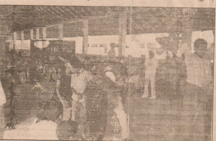
யாழ்ப்பாணம் கல்வி வலயத்தால் நல்லொருங்கோட்டப் பாடசாலைகளில் கல்வி பயிலும் விசேட தேவையுடைய மாணவர்களுக்கு காண சிறுவர் முகாமும் பெற்றோருக்கான விழிப்புணர்வுச் செயற்பாடும் அண்மையில் நடைபெற்றது. இந்நிகழ்வில் விசேட கல்வி ஆசிரிய ஆலோசகர் கருத்துரை வழங்குவதை முதலாவது படத்திலும், உரையுரை கணேச வித்தியா சாலையில் கல்வி கற்கும் விசேட தேவையுடைய மாணவர்களுக்கான சிறுவர் முகாமில் மாணவர்கள் இணைந்து நடாத்திய சிறுவர் அரங்க நிகழ்ச்சியை இரண்டாவது படத்திலும் காணலாம்.