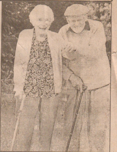
தூக்க அலுவலர்களின் மகன் கூறினார். (அ-5)

படுக்கை செல்லும் போது ஒரு போது தீய எண்ணாங்களுக்கு இடம் கொடுக்காமையே தமது நீண்ட திருமண வாழ்வின் இரகசியம் என தனது பெற்றோர் தெரிவித்தார்.