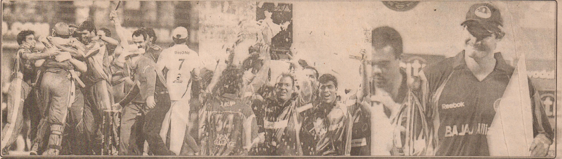
ஐ.பி.எல் இருபது-20 கிரிக்கெட் தொடரின் இறுதிப்போட்டியில் சென்னை சுப்பர் கிங்ஸ் அணியை வீழ்த்திய ராஜஸ்தான் ரோயல்ஸ் அணியினர் மகிழ்ச்சியைக் கொண்டாடுவதை முதலாவது படத்திலும், ஐ.பி.எல் கிண்ணத்துடன் வோர்ன் அணி வீரர்களை இரண்டாவது படத்திலும், தொடரின் நாயகனான ஷேன் வோட்சன் விருதுடன் காணப்படுவதை மூன்றாவது படத்திலும் காணலாம்.