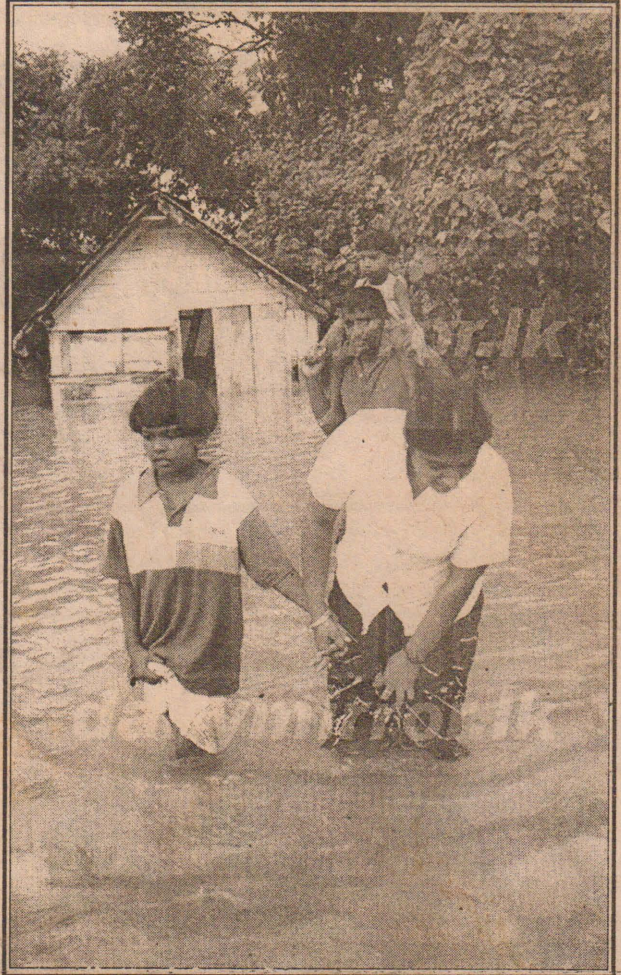
கடும் மழையினால் வீட்டிலுள் வெள்ளம் புகுந்ததையடுத்து இடம்பெயரும் ஒரு குடும்பம்.