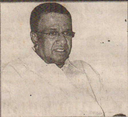
நான்கு நாட்களாக ஓமந்தையூடான போக்குவரத்துக்குத் தடை (வவுனியார்)

ஓமந்தை சோதனை நிலையம் நான்கா வது நாட்களாக நேற்றும் மூடப்பட்டிருந்தமை யால் வன்னிப் பகுதி மக்கள் கடும்கொண்ட கடினமான சந்தித்துள்ளனர்.