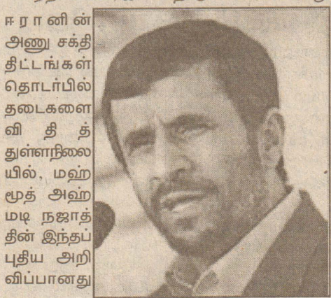
மேற்குலக நாடுகளுக்கு சவால் விடுக்கும் வகையில் அகவமவதாக தெரிவிக்கப்படுகிறது (அ-6)

டுள்ளது எனக் கூறி வருகிறது. ஏற்கனவே, ஐக்கிய நாடுகள் சபையானது ஈரானின் அணு சக்தி திட்டங்கள் தொடர்பில் தடைகளை விதித்துள்ள நிலையில், மஹ்மூத் அஹ்மது நஜாத் தின் இந்தப் புதிய அறிவிப்பானது