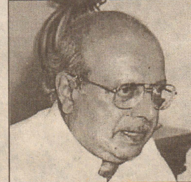
பில் ஐக்கிய தேசியக் கட்சியுடன் பொதுவான உடன்பாட்டுக்கு வந்ததன் பின்னரே தமிழ்த் தேசியக் கூட்டமைப்பை சர்வகட்சிப் பிரதிநிதிகள் குழுவில் அழைக்க முடியும் என குழுவினர் தலைவரும் அமைச்சருமான பேராசிரியர் திஸ்ஸ விதாரண தெரிவித்துள்ளார்.

(கொழும்பு) வடக்குக் கிழக்குப் பிரச்சினைக்கான அரசியல் தீர்வுப்பொதி தொடர்