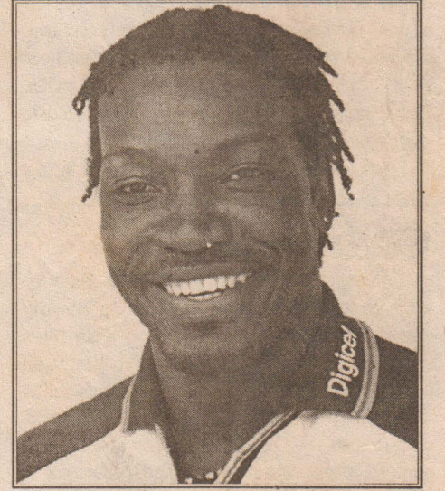
யன் தொடருக்காக புதிய அணித்தலைவர் தேர்ந்தெடுக்கப்படுவார்.