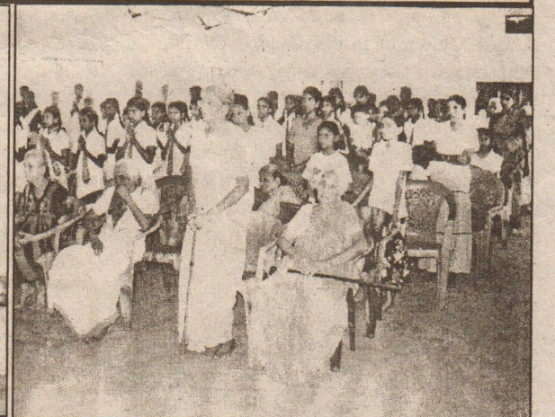
தொல்புரம் சிவபூமி முதியோர் இல்லத்தில் ஆடி அமாவாசை தினத்தன்று அளவெட்டி அருணாதயாக் கல்லூரி மாணவ மாணவியரால் முதியோரை மகிழ்வுக்கும் முகமாக பல்வேறு கலைநிகழ்ச்சிகள் நடத்தப்பட்டன. கோட்ட மட்டத்தில் முதலிடப் பெற்ற மட்டக்களப்பு கிராமிய பண்பாட்டு நாடகத்தில் ஒரு காட்சியையும், பண் இசை கச்சேரி நிகழ்த்துவதனையும், நிகழ்வல் பங்குபற்றிய முதியோருடன் மாணவ மாணவிகளையும் படங்களில் காணலாம்.