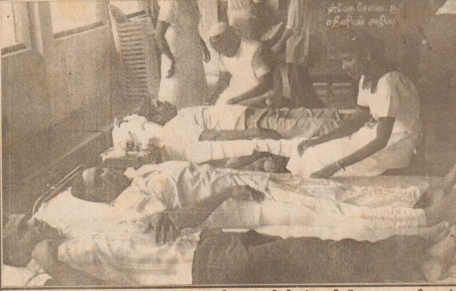
உள்ளூராட்சி வாரத்தினை முன்னிட்டு வலி.கிழக்கு பிரதேச சபையினால் கடந்த மாதம் 28ஆம் திகதி ஏற்பாடு செய்யப்பட்ட இரத்ததான நிகழ்வில் புத்தூர் கலைமதி சனசமூக நிலையத்தினர் இரத்ததானம் செய்வதைப்படத்தில் காணலாம்.