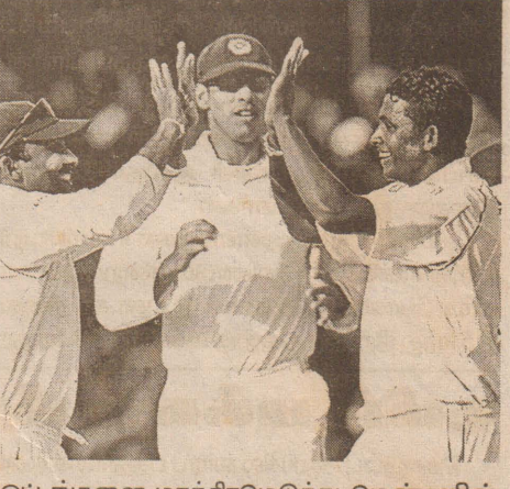
ஓட்டங்களை மாத்திரமெடுத்து மென்டிஸின் பந்துவீச்சில் எல்.பி.டபிள்யூ முறையில் ஆட்டமிழந்தார்.

இந்த ஆட்டமிழப்புத் தீர்ப்பை எதிர்த்து டெண்டல்கர் மூன்றாவது நடுவரிடம் மேன்முறையீடு செய்தபோதும் அது பலனளிக்கவில்லை.