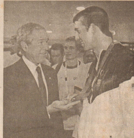
அவரது மனைவி லாரா மற்றும் மகன் பார்பரா ஆகியோர் கண்டு களித்தனர்.

போட்டியின் முடிவில் புஷ், பெல்ப்ஸுக்கு வாழ்த்துத் தெரிவித்தார்.