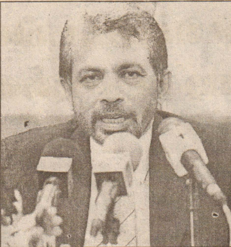
ஆரம்பத்தில் இலங்கை வந்த அவர் அக்ஷன்பெய்ம் நிறுவனப் பணியாளர்களின் படுகொலைகள் தொடர்பான தரவுகளைத் திரட்டி வருவதாக அக்ஷன்பெய்ம் நிறுவனம் அறிவித்திருந்தமை இங்கு குறிப்பிடத்தக்கது. (அ-6)

இதேவேளை அக்ஷன்பெய்ம் நிறுவனப் பணியாளர்களின் படுகொலைகள் குறித்த விசாரணைகளை மேற்கொள்வதற்கு பிரான்ஸ் நாட்டின் நீதவான் நீதிமன்ற நீதிபதி ஒருவர் இலங்கை வந்துள்ளார். கடந்த ஜூலை மாத