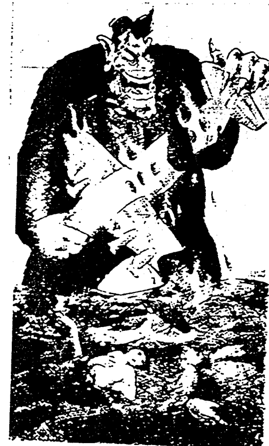
Kinokong Reenan frist iranische Flugzeute Aus der iranischen Tageszeitung 'Kavkan' vom Montag

* கனகம் உனது நாடகத்தில் சிவசிக் குடாவில் (150 சிவசிக் குடாவில்) மனிதர்களுள் சிவசிக் குடாவில் மனிதர்களுள் சிவசிக் குடாவில் சிவசிக் குடாவில் சிவசிக் குடாவில் சிவசிக் குடாவில்.