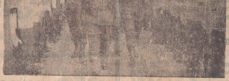
காவர்துறை பெண் உறுப்பினரின் அணியை தலைவர் பார்வையிடுகிறார்.

பீப்பாக்க குண்டுகளை உருட்டி வீழ்த்தியது. மேலும் முகூறு குண்டு வீச்சு விமானங்களை இடைவிடாது குண்டு வீச்சுகளை நடாத்தின. கடற்கரை பகுதியை அண்டியதாக இருந்த தனால்தான் (3 ஆம் பக்கம் பார்க்க)