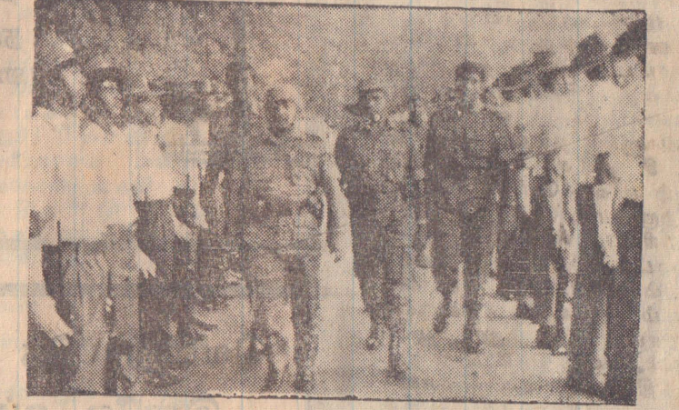
காவர்துறை ஆண் உறுப்பினர்கள் அணியை தலைவர் பார்வையிடும் காட்சி.