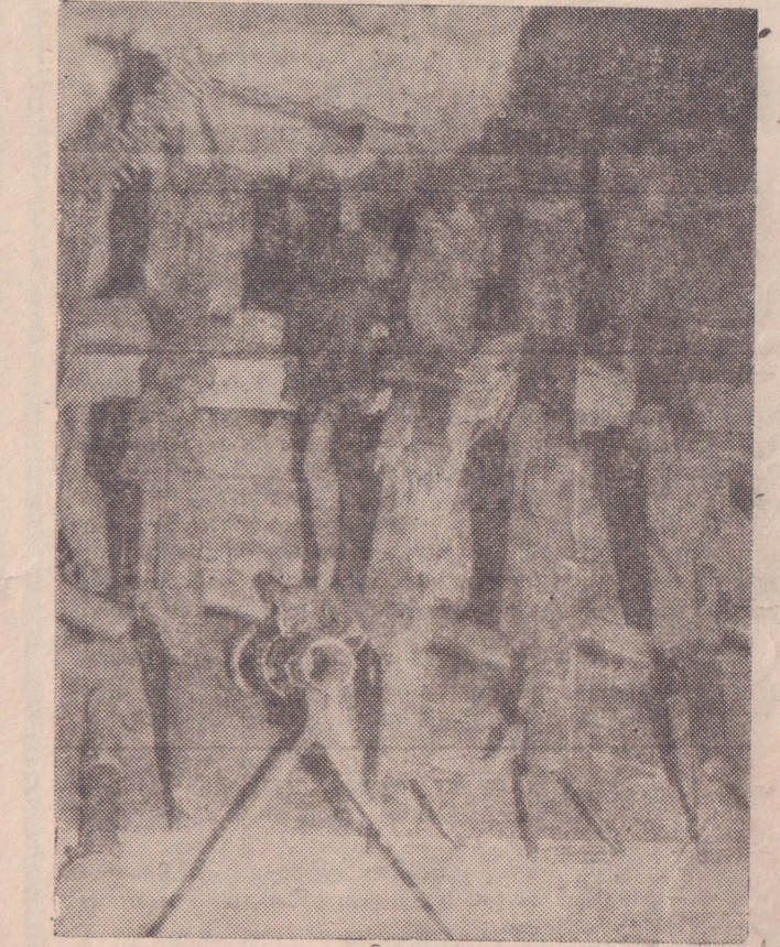
புலிகளின் தாக்குதலால் சிதறி ஓடிய ஸ்ரீலங்காப் படையினரின் ஆயுதங்களில் கைப்பற்றப்பட்ட ஒரு தொகுதி

கடந்த யூன்மாதம் 11 ஆம் திகதி விடுதலைப் புலிகளுக்கும் சிறிலங்கா இராணுவத்தினருக்கும் இடையில் ஆரம்பமான சண்டையைத் தொடர்ந்து யாழ். கோட்டையை விட்டு