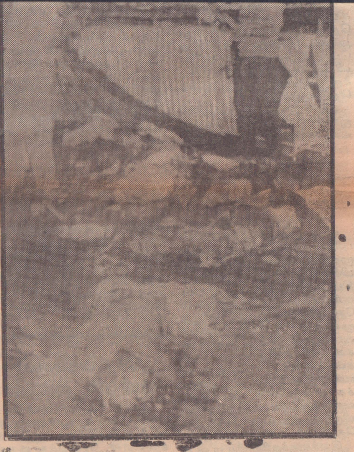
கடந்த திங்களன்று குண்டு வெடிப்பு நிகழ்ந்தபோது காமினி திசாநாயக்காவின் கூட்டம் நடந்த மேடையையும் அம் மேடைக்கு முன்னால் குண்டு வெடிப்பில் கொல்லப்பட்ட சிலரின் சடலங்கள் கிடப்பதையும் பிள்ளை படத்தில் காணலாம்.

காமினி திசாநாயக்காவின் கொலைதொடர்பாக கிடைத்துள்ள ஆதாரங்கள் விரைவில் வெளியிடப்படுமென அறிவிக்கப்பட்டுள்ளது. எனினும் விசாரணைகள் முடிவடைந்த பின்பே உத்தியோகபூர்வமாக அரசு தகவல்களை வெளியிடும் எனவும் தெரிவிக்கப்பட்டுள்ளது.