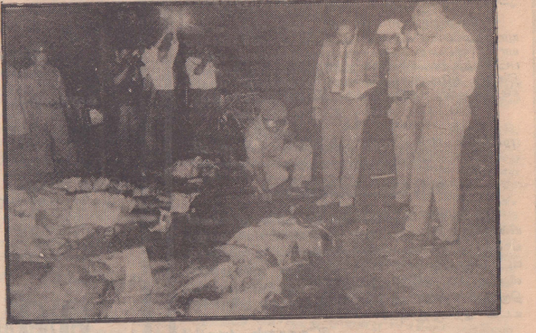
கடந்த திங்களன்று நடைபெற்ற கொழும்பு குண்டு வெடிப்பின் போது கொல்லப்பட்ட சிலரின் சடலங்களை சிதறுண்டு கிடப்பதை மேலுள்ள படத்தில் காணலாம்.

தக் கப்பல்களையும் தாக்க திட்டமிடுவதாகவும், இவ்வாறான தாக்குதலுக்கு பயன்படாத தளங்களையும் யுத்