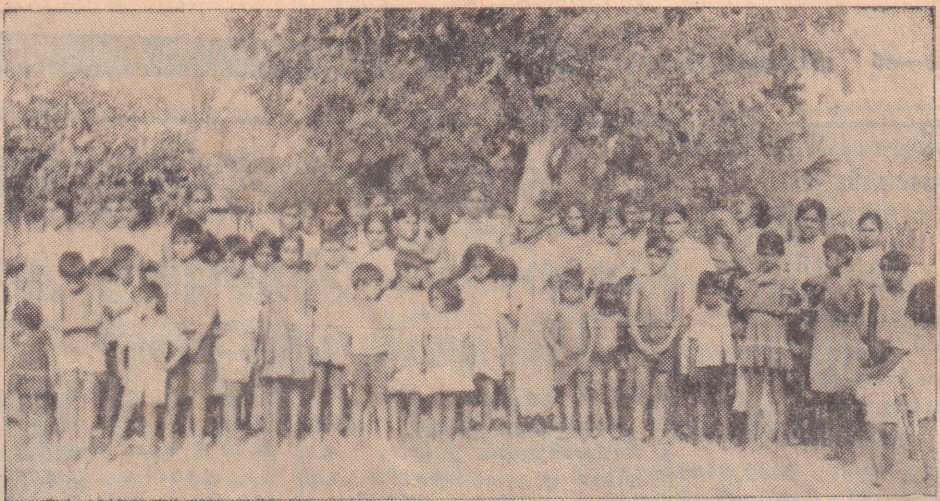
வவனியாவில் ஏற்பட்ட வன்செயலில் பாதிப்புற்று, அங்கிருந்து அகதிகளாக வெளியேறி கிளிநொச்சியில் தஞ்சம் அடைந்த ஏராளமான குழந்தைகளில் ஒருபகுதியினரை இங்கு காணலாம். (மற்றுமொரு படம் ஐந்தாம் பக்கம்)

(கொழும்பு) பட்டுள்ளது. அத்துடன் இவ் விர சாக் டாக்டர்கள் விடயம் ஜனாதிபதியின் கவனில் அனுராதபுரம், திரு வந்திற்கும் கொண்டுவரப்பட்ட கோணமலை, பதவியா, டி.என்.எ. போலநறுவை ஆகிய இடங் களில் பணியாற்ற மறுத் தெரிவித்துள்ளனர் என்று தெரிவிக்கப்பட்டுள்ளது. போதிய பாதுகாப்பில் இடம் பெறாத காரணம் காட்டி தாங்களும் தெரிவிக்கப்பட்டது. அவர்கள் மேற்குறிப்பட்ட இடங்களில் பணியாற்ற மறுத் துள்ளனர் என்று தெரிவித்துள்ளனர். இது குறித்து சுகாதார அமைச்சுக்குப் புரூர் செய்யப் பட்டுள்ளது.