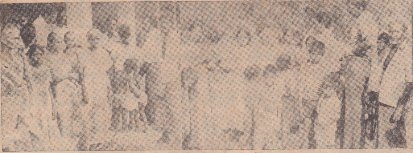
வவனியாவில் கடந்த வெள்ளிக்கிழமை ஏற்பட்ட வன்செயலின்போது பாதிப்பிற்கு, அகதிகளாக வெளியேறி கிளிநொச்சியில் தஞ்சமடைந்தவர்களில் ஒரு பகுதியினரை இங்கு காணலாம், தங்களுக்கு ஏற்பட்ட அவல நிலையை, கிளிநொச்சி அரசாங்க அறிவிப்பில் விவரமாக கூறுவதை இண்டாவதுபடி காணலாம். (கடைசியப்பக்கமும் பார்க்க)