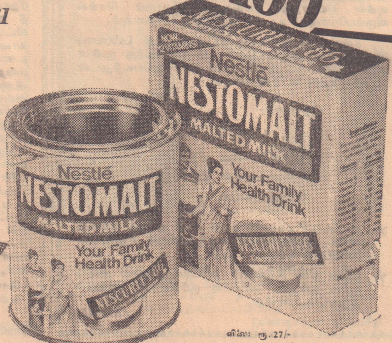
விலை: ரூ. 27/-