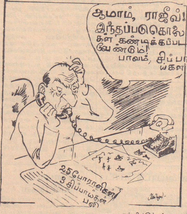
— நன்றி 'இந்து'