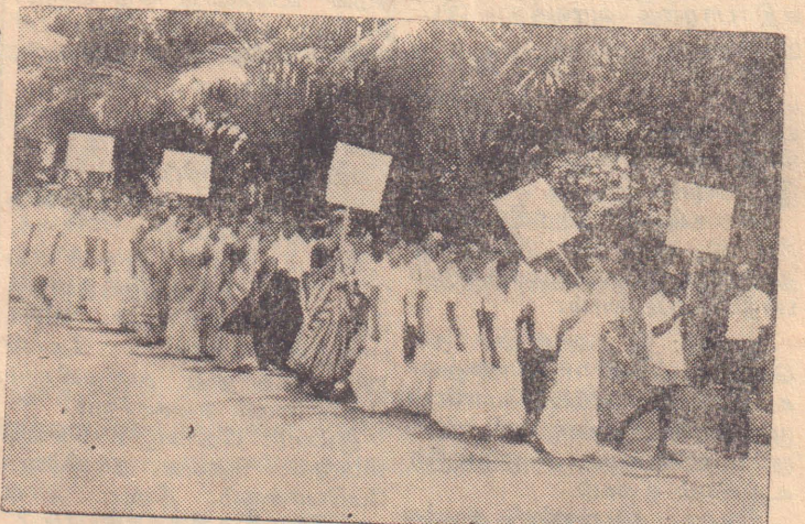
யாழ். ஆஸ்பத்திரியில் கடந்த 30-ந் திகதி எட்டு நோயாளிகளையும், ஒரு ஊழியரையும் பலிகொண்ட கோட்டை இராணுவத்தின் 'ஷெல்' தாக்குதலைக் கண்டித்து தெல்லிப்பழை அரசினர் வைத்தியசாலை ஊழியர்களால் தெல்லிப்பழையில் நடத்தப்பட்ட கண்டன ஊர்வலத்தைப்படத்தில் காணலாம்.

இரவு சுமார் 10 மணியளவில் ஆரம்பமான இச்சமர் சுமார் ஒருமணிவரை நீடித்தது. இறந்தவரின் சடலம் ஹெலிகொப்டர் மூலம் கடற்படைத் தளத்திற்கு பின்னர் எடுத்துச் செல்லப்பட்டது.