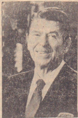
நிராகரிப்பையும் செல்லுபடியாக்க முற்பட்டார்.

ஆனால் அமெரிக்க காங்கிரஸின் செனட், மற்றும் மக்கள் பிரதிநிதிகள் சபை ஆகிய இரண்டும் கூட்டாக திரு.