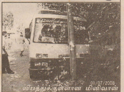
01/07/2008 விபத்துக்குள்ளான மினிவான்

நேற்றுக் காலை 6.30 மணியளவில் காரைநகரிலிருந்து புறப்பட்ட மினிவானின் முன் சக்கர ரயர் வெடித்ததில் இவ் விபத்து இடம்பெற்றுள்ளது. மினிவானில் பயணித்தவர்கள் தெய்வாதீனமாகக் காப்பாற்றப்பட்டனர். (ச-7)