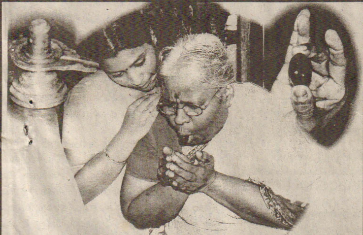
சிவராத்திரி தினத்தன்று வாயிலிருந்து எடுத்த சிவலங்கத்தையும் அம்மா வாயினூடாக ஹிரண்ய கர்ப்பலிங்கம் எடுப்பதையும் படங்களில் காணலாம்.

வாய்வழியாக சிவலங்கத்தை எடுத்து வருகின்றார். இம்முறையும் செப்பிலான சிவலங்கத்தையும் ஹிரண்யகர்ப்ப சிவலங்கத்தையும் அவர்வாயிலிருந்து எடுத்துள்ளார். இவ் அதிசய நிகழ்வை பெருந்திரளான பக்தர்கள் நேரில் கண்டுகளித்தனர். (ச-7)