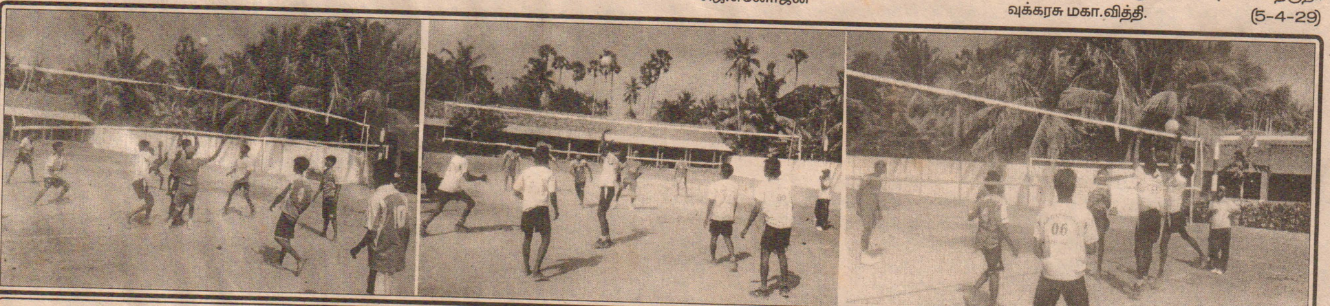
சண்டிலிப்பாய் பிரதேச செயலகத்திற்குட்பட்ட கழகங்களுக்கிடையிலான கரப்பந்தாட்டப் போட்டியில் கழக அணிகள் மோதும் காட்சிகள்...