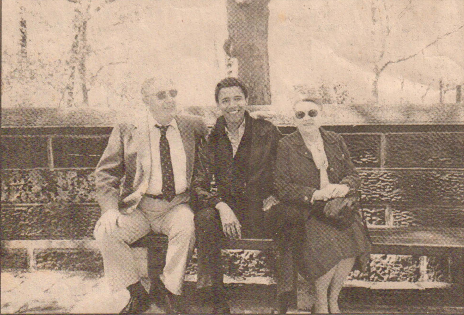
1980 இல் நியூயோர்க்கில் உள்ள கொலம்பியா பல்கலைக்கழகத்தில் ஒபாமா படித்துக்கொண்டிருந்த போது எடுக்கப்பட்ட படம்

1995- தன்னைப் பற்றிய நூலான "எனது தந்தையின் கனவுகள்" வெளியிடப்பட்டது. இதில் தன்னுடன் வாழாத தந்தையோடுள்ள உறவு, இனவாதம் பற்றிய தனது கருத்துகள், போதைப்பொருளோடு தன் அனுபவம், கென்யா யாத்திரை இன்னோ ரன்ன விடயங்கள் பேசப்படுகின்றன. சில மாதங்கள் கழிந்ததும் அவருடைய தாய் கருப்பைப் புற்றுநோயால் பீடிக்கப்பட்டு உயிர் நீர்த்தார். அப்போது அவருக்கு 52 வயது. 1996- ஒபாமா இல்லினோயிஸ் மாநிலத்