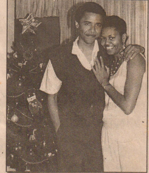
1992 இல் ஒபாமா-மிசேல் திருமணம் நடைபெற்றது

சிறந்த நூலான இதனைக் கணக்கற்ற வாசகர்கள் வாங்கிச் சென்றனர்.