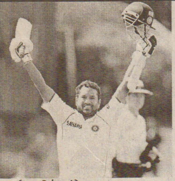
(ஹமில்டன்) டெண்டுல்காரின் சிறப்பான சதம்

தின் மூலம் இந்திய அணி முதலாவது இன்னிங்ஸில் சகல விக்ரெட்டுக்களையுமிழந்து 520 ஓட்டங்களைக் குவித்தது. தொடர்ந்து தனது இரண்டாவது இன்னிங்ஸில் துடுப்பெடுத்தாடியவரும் நியூசிலாந்து அணி நேற்றைய மூன்றாம் நாள் ஆட்ட நேர முடிவில் 75 ஓட்டங்களை எடுத்து 3 விக்ரெட்டுக்களையிழந்து தடுமாறி வருகின்றது. நியூசிலாந்திற்கு சுற்றுப்பயணம் மேற்கொண்டுள்ள இந்திய அணி 2 இருபது-20,5 ஒருநாள் மற்றும் 3 டெஸ்ட் போட்டிகள் கொண்ட தொடரில் விளையாடுகின்றது.