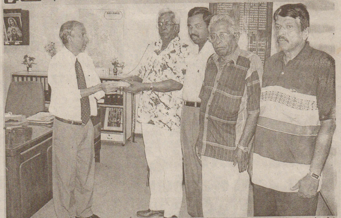
வன்னியிலிருந்து இடம் பெயர்ந்து யாழ்ப்ப. மாவட்டத்திலுள்ள நலன்புரி நிலையங்களில் தங்கியுள்ள மக்களின் அத்தியாவசிய தேவை களுக்கு உதவும் பொருட்டு வடமராட்சி ஸ்ரீ வல் லிபுர ஆழ்வார் தேவஸ்தான பரிபால சபை யினரால் ஒரு இலட்சம் ரூபாய் அன்பளிப்பாக வழங்கப்பட்டது.