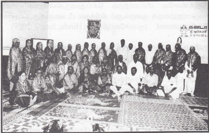
திருமுறை முற்றோதல் நிறைவு விழாவில் கௌரவம் பெற்ற அடியார்களும் இந்து சமயப் பேரவை நிர்வாகிகளும்.