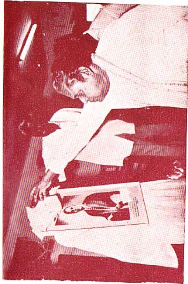
பேராசிரியர் மருத்துவ கலாநிதி