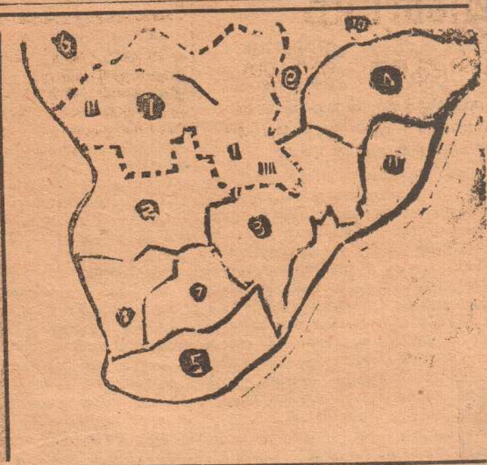
1. காங்கோ 2. அங்கோலா 3. ரொடீஷியா (ரொடீஷியாவில்தான் விமான விபத்தில் திரு.ஹம்மர்ஷீல்ட் உயிரிழந்தார்.)