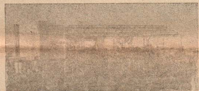
கல்லடியில் குருவாளியால் சாந்தி இழந்து நிற்கும் 'சாந்தி' படமாளிகை

கிளைகளில் குடுப்பை குதித்துக் விடவேண்டும். அது மி. சுவசியம்; அவர் களப்புப் பகுதிக்குச் சென்று வந்தால் மனிதன் மனிதனாக வான்—என்று உண்மையே தான்! —இரக்கமே இல்லாதவர் களுக்கு இரக்கம் பிறக்கும். அன்பு, கருணை என்ன வென்று புரியு! “திருவாசகத்துக்கு உருகாதார் ஒரு வாசகத்துக்கும் உருகார்”—என்பார்களே.