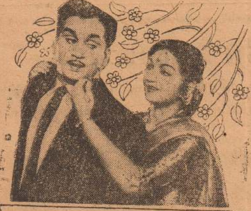
அசோகியைப் புரொட்யூசர்ஸ் எங்கள் செல்வி