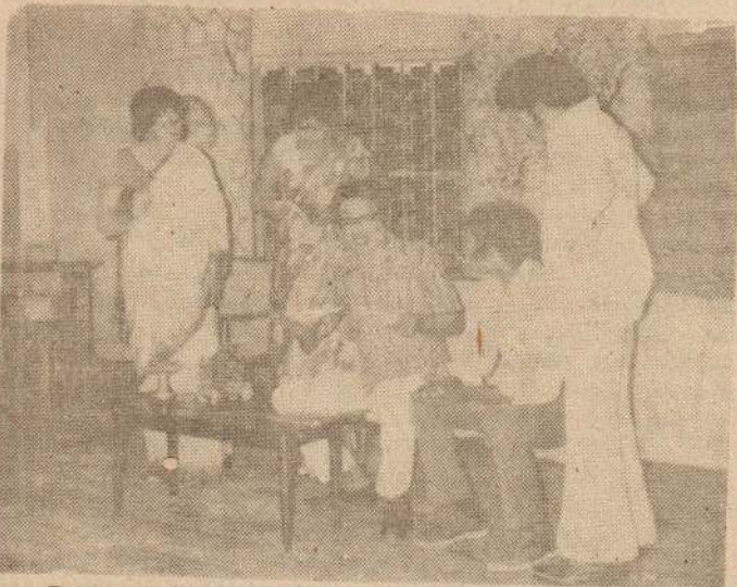
இன்று மாலை வீரகங்கம் மண்டபத்தில் மேடையேறும் 'இனி என்ன கலியாணம்' தலைச்சுவை நாடகத்தில் சுவையான ஒரு கட்டம்.