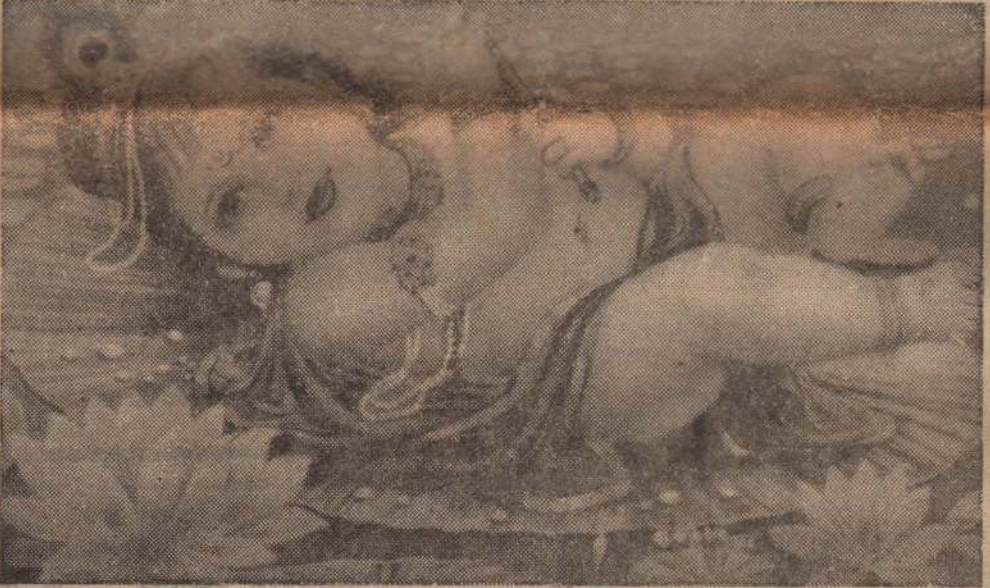
அனைவருக்கும் எமது இதயங்களிந்த தீபாவளி வாழ்த்துக்கள்!

யோகேந்திரா வாழ்த்து தீபதிருநாளாக இத்தீபாவளி நந்தாளில் தமிழ் மக்கள் அனைவருக்கும் எனது வாழ்த்துகளை மகிழ்ச்சியுடன் தெரிவிக்கிறேன்.