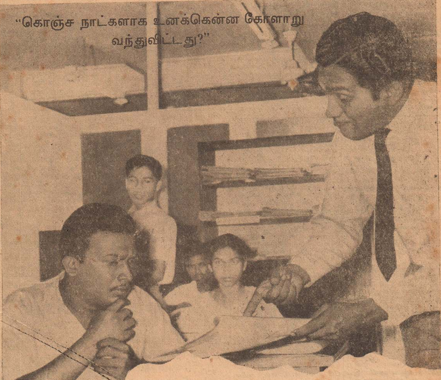
"கொஞ்ச நாட்களாக உனக்கென்ன கோளாறு வந்துவிட்டது?"

சும் இடையில் காங்கேசன் துறை ரேயல் விளையாட்டுக் கழக சுற்றுப்போட்டியின் அமைப்பின் கீழ் நடைபெற்ற கைப்பந்தாட்டப் போட்டியில் ரொக்கட் கோஷ்டி 2-0 ஆட்டங்களினால் வெற்றியீட்டியது.