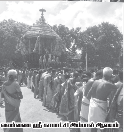
துவாளி கண்ணகை அம்மன் ஆலயம்.