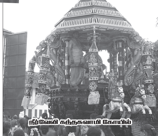
நர்வேலி கந்தசுவாமி கோயில்