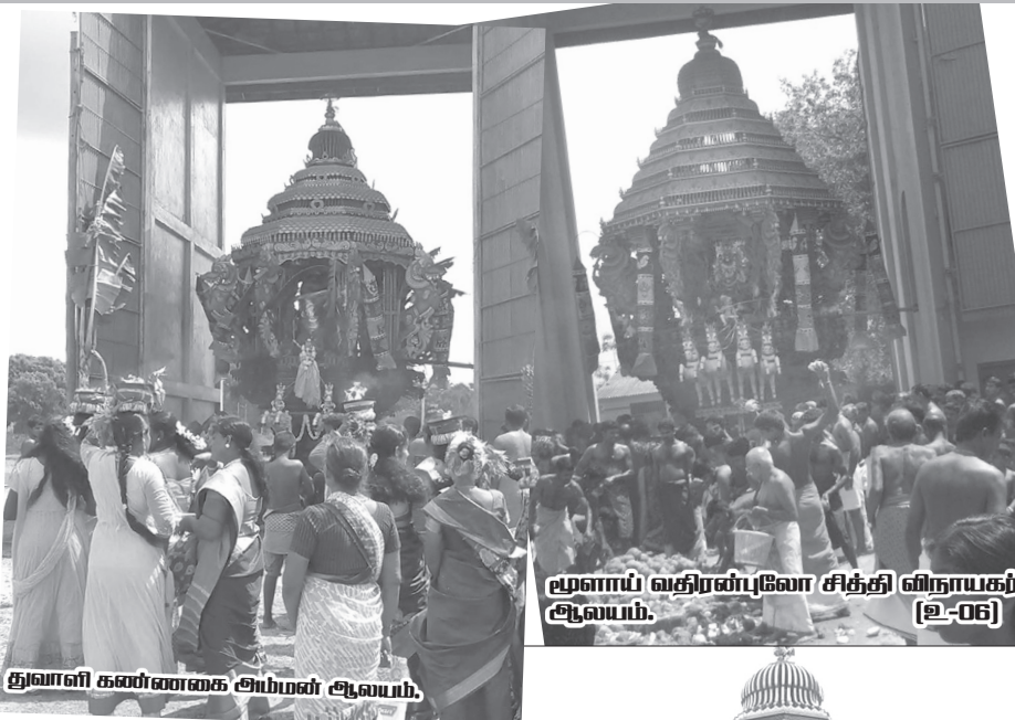
மூளாய் வதிரன்புலோ சித்தி விநாயகர் ஆலயம். [உ-06]