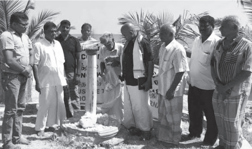
முள்ளிவாய்க்கால் நினைவு வாரத்தின் இரண்டாம் நாள் நினைவேந்தல் சுடர் வல்லைப் படுகொலைகள் நினைவாக பொலிகண்டி பகுதியில் இன்று காலை ஏற்றப்பட்டது. (எ)

இன்தெரியாத ஒருவர் நேற்றிரவு 10.30 மணியளவில் இந்த கைக்குண்டை மருத்துவ சபையை நோக்கி வீசியிருக்கலாம் எனவும், ஆயினும், அந்தக் குண்டு வெடித்திருக்க வில்லையெனவும் மருத்துவ சபை உறுப்பினர் ஒருவர் தெரிவித்துள்ளார்.