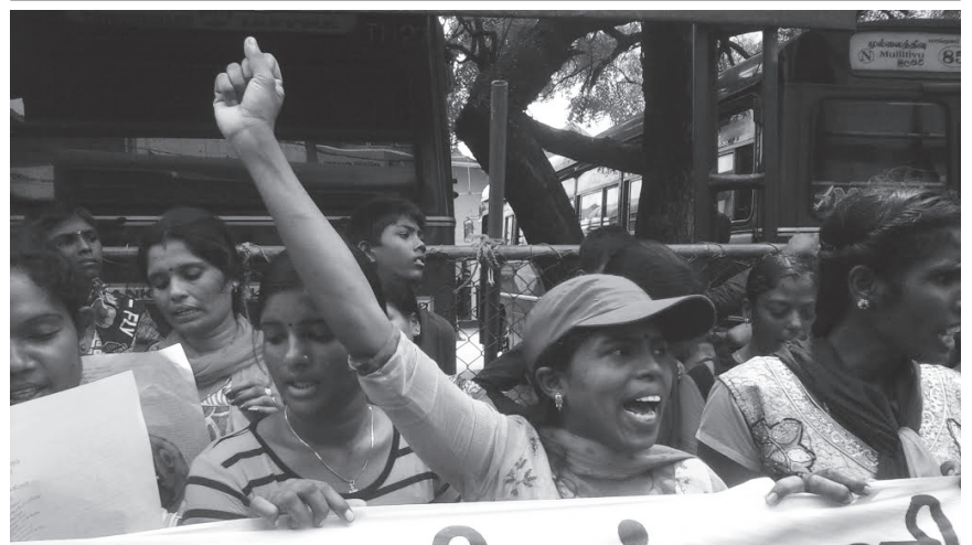
மக்கள் குடியிருப்புக்களுக்கு மத்தியில் உள்ள மயானங்களை அகற்றக்கோரி சமூக நீதிக்கான வெகுஜன அமைப்பின் ஏற்பாட்டில் கவனயீர்ப்புப் போராட்டம் ஒன்று இடம்பெற்றுள்ளது. யாழ்ப்பாணம் பிரதான பேருந்து நிலையத்திற்கு முன்னால் இன்று முற்பகல் 10 மணிக்கு குறித்த கவனயீர்ப்புப் போராட்டம் இடம்பெற்றது.