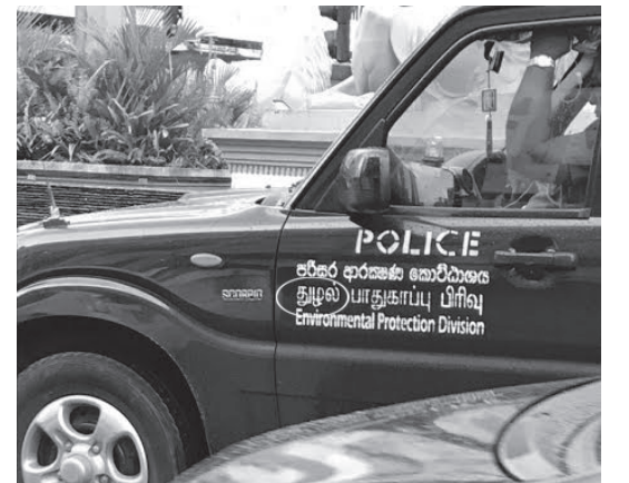
கொழும்பில் தமிழை கொச்சைப்படுத்தும் வகையில் பொலிஸ் வாகனத்தில் தமிழ் எழுத்துக்கள்.