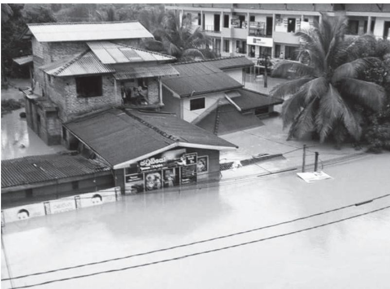
நாட்டின் பல பகுதிகளிலும் நேற்றுமுன்தினம் தொடக்கம் இன்று வெள்ளிக்கிழமை காலை வரை தொடர்ச்சியாக பெய்த கடும் மழையால் குடியிருப்புகள் மற்றும் வீதிகள் வெள்ளத்தினால் மூழ்கியுள்ளன. அத்துடன் மண்சரிவினால் உயிரிழப்புகளும் ஏற்பட்டுள்ளன.