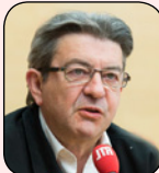
Gauche Radicale - Jean Luc Mélenchon :

தீவிர இடதுசாரிக் கட்சியின் ஆதரவு. 2012 தேர்தலில் 1,15% வாக்குகள் பெற்றவர்.