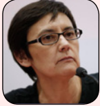
Lutte Ouvrière - Nathalie Arthaud :

தற்போதைய நிலையில் அங்கீகரிக்கப்பட்ட வேட்பாளர்களாக பட்டியலிடப்பட்டுள்ளவர்கள் :