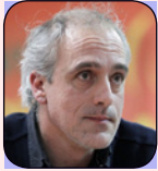
Nouveau Parti Anticapitaliste - Philippe Poutou :

தீவிர இடதுசாரிக் கட்சியின் ஆதரவில் களமிறக்கப்பட்டுள்ளார். 2012 தேர்தலில் 0,56% வாக்குகள் பெற்றவர்.