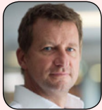
Europe Écologie Les Verts - Yannick Jadot

தீவிர இடதுசாரிக் கட்சியின் முக்கிய ஆளுமை Front de gauche வேட்பாளராக 2012ல் போட்டியிட்டு முதல் சுற்றில் 11,1% வாக்குகள் பெற்றிருந்தார். தீவிர இடது சாரிகள் மற்றும் கொம்யூனிஸ்ட் கட்சிகளின் முக்கிய நம்பிக்கையும் இவரே. தனது தீவிர பேச்சுத் திறமையால் தொடர்ந்து தேர்தல் பிரச்சாரங்களில் முன்னணி வகித்து வருகின்றார்.