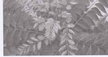
படம் : 3 கறிவேப்பிலை