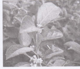
சிறுகுறிஞ்சா படம் : 1

யாழ்ப்பாணப்பூமியானது வறண்ட உவர்தன்மையுள்ள கிணற்று நீரை அதிகம் கொண்ட பிரதேசமாகும். இங்கு வாழும் மூலிகைகள் யாழ்ப்பாண தட்ப-வெப்ப நிலைகளுக்கேற்ப இயற்கையாக வளருகின்றனவாகும். இம் மூலிகைகளில் காணப்படும் வேதியற் பொருட்கள் செறிவானதும், மருத்துவ குணத்தில் சிறந்ததுமாகும். இதனால்தான் வேறு பிரதேசங்களை விட யாழ்ப்பாண மூலிகைகள் சிறப்பானவையாகக் காணப்படுகின்றன. இதற்கு ஏற்றாற் போல் யாழ்ப்பாணத்தில் மூலிகைகள் வைத்திய முறைக்குப் பெரும் வரவேற்பு காணப்படுகிறது. இக் காரணத்தினால் பல்வேறு நோய்களுக்குரிய பல்வேறு மூலிகைகளை வைத்திய முறைகளுக்கு பயன்படுத்தப்பட்டு வருகின்றன. இருமல் சளி போன்றவற்றுக்கு இக்கிரி, துளசி, தூதுவளை, ஆடாதோடை, கண்டங்கத்திரி போன்ற வையும், வாதநோய்க்கு வாதமடக்கி, ஆமணக்கு, நொச்சி என்பனவும் பயன்பட்டது போல் நீரிழிவு நோய்க்கு சிறுகுறிஞ்சா, நாவல், ஆவாரை, கொவ்வை, கறிவேப்பிலை, வேம்பு, அறுகம்புல், பலாவிலை, துளசி, பாகற்காய் போன்ற மூலிகைகளை மக்கள் பயன்படுத்தி வந்தமை ஆய்வாளர்களினால் அறியப்பட்டது. யாழ்ப்பாணத்து மூலிகைகள் மனித உடலில் செயற்படும் விதம் பற்றி ஆய்வுகள் இதுவரையில் மேற்கொள்ளப்படாமல் இருந்ததும், அதனை மருத்துவ விஞ்ஞானரீதியில் நிரூபிப்பதற்காக இன்று மக்களால் கூடுதலாகப் பயன்படுத்தும் இந்த ஐந்து மூலிகைகளும் இங்கு தெரிவு செய்யப்பட்டுள்ளன.