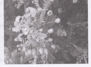
ஆவாரை படம் : 2