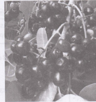
படம் : 5 நாவல்