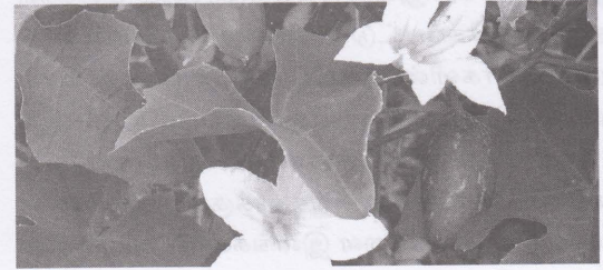
படம் : 4 கொவ்வை