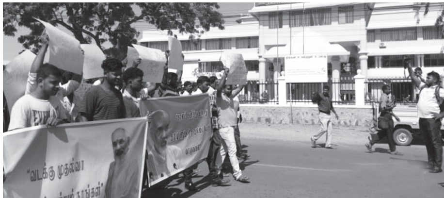
முதலமைச்சர் விக்னேஸ்வரனுக்கு ஆதரவாக முல்லைத்தீவில் இன்று அமைதிப் பேரணி இடம்பெற்றது.