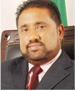
எடுத்துக் கொள்ளப்பட்டது. இதன்போது, இந்த வழக்கின் கணினி ஆதாரங்களை ஆய்வு செய்ய பிரதிவாதியாகக் குறிப்பிடப்படும் தனியார்

முறையற்ற விதத்தில் 400 லட்சத்துக்கும் அதிக சொத்து சேர்த்ததாகக் கூறப்படும் சம்பவம் தொடர்பில், நாடாளுமன்ற உறுப்பினர் ரோஹித அபேகுணவர்த்தனவுக்கு எதிராகத் தாக்கல் செய்யப்பட்ட வழக்கை, ஓகஸ்ட் 2 ஆம் மற்றும் 3 ஆம் திகதிகளில் விசாரணைக்கு எடுத்துக் கொள்ளத் தீர்மானிக்கப்பட்டுள்ளது. கொழும்பு மேல் நீதிமன்றத்தில் இந்த வழக்கு நேற்று விசாரணைக்கு