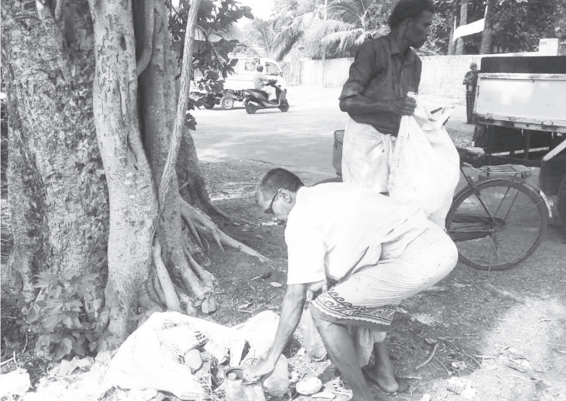
புளொட்டின் 28ஆவது வீரமக்கள் தினத்தை முன்னிட்டு வட்டுக்கோட்டைத் தொகுதி கட்சி அங்கத்தவர்கள், ஆதரவாளர்கள் மற்றும் பொதுமக்களால் தொகுதி நலனைப் பேணுதல் எனும் தொனிப்பொருளில் நேற்று முன்தினம் சுழிபுரம் கிராமத்தில் குப்பைகளையும், கழிவுகளையும் அகற்றுக் கத்திகரிப்புப் பணிகள் முன்னெடுக்கப்பட்டிருந்தன.

சாயி நிலையத்தில் “குரு பூர்ணிமாதினம்” கொழும்பு புதுச்செட்டித் தெருவிலுள்ள சாயி நிலையத்தில், சத்யசாயிபாபா மத்திய நிலையமும், சீரடிசாயி மத்திய நிலையமும் இணைந்து “குரு பூர்ணிமாவழிபாடு” நிகழ்வை, எதிர்வரும் 8 ஆம் திகதி, சனிக்கிழமை, பெளர்ணமி தினத்தன்று, காலை 8 மணிக்கு ஒழுங்கு செய்துள்ளனர். இலங்கையில் சாயி நிலையத்தில் வைக்கப்பட்டிருக்கும், மதுரை பாதுகா டிரஸ்ட் மூலம் கிடைக்கப்பட்ட, பகவான் சத்ய சாயிபாபாவின் பொற்பாதங்களில் அணிவித்த பாதரட்சைக்கும், அகில இந்திய சீரடிசாயி சமாஜமான, சென்னை சீரடிசாயி ஆலயத்திலிருந்து பிரதிட்சை செய்யப்பட்ட சீரடிசாயிநாதரின் வெள்ளித்திருப்பாதத்துக்கும், சாயி பக்தர்களினால் அபிஷேக பூஜை இடம்பெறவுள்ளது. அதனைத் தொடர்ந்து அன்னதானம் வழங்கப்படும். இலங்கையில் கொழும்பிலுள்ள சாயி நிலையத்தில் இவ்விரு சாயி பொக்கிஷங்களும் சக்திவாய்ந்தவையாக உள்ளன. குரு பூர்ணிமாதினத்தில் இவற்றை வழிபாடு செய்வது மிகவும் முக்கியமானதாகும் என ஏற்பாட்டாளர்கள் தெரிவிக்கின்றனர். (இ)