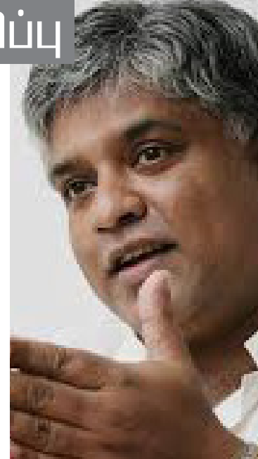
செயற்படுகின்றார்கள். இந்த நிலைப்பாடுகள் தொடர்ந்தால் அழிவை நோக்கியே பயணிக்க வேண்டிய நிலை ஏற்படும். -என்றார்.

வேண்டும் என்று இந்நாட்டு தமிழ், முஸ்லிம் மக்கள் கோரவில்லை. அதனால் பௌத்த மதத்தின் முன்னுரிமையையும் பாதுகாத்துக்கொண்டு மற்றைய மதத்தவர்களின் கடமைகளைச் செய்வதற்கும் இடமளிக்க வேண்டும். உலக நாடுகள் அனைத்தும் இவ்வாறுதான் செயற்படுகின்றன. எனவே, சிலர் உண்மைக்கு புறம்பான விடயங்களையே கூறிக்கொண்டிருக்கின்றார்கள். அரசமைப்பு இன்னும் ஒரு சாசனமாக வகுக்கப்படவே இல்லை என்கின்ற போது எந்தவித ஆதாரங்களும் இன்றியே இவர்கள் பேசுகின்றார்கள். எவ்வாறாயினும் இவ்வாறு போலியான கருத்துக்களை வெளியிடுகின்றவர்கள் குறுகிய அரசியல் நோக்கத்திலேயே