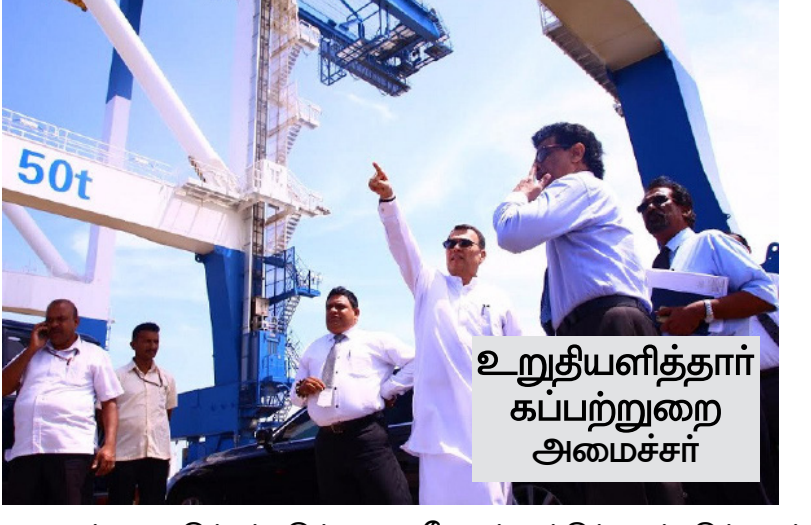
உறுதியளித்தார் கப்பற்சங்க அமைச்சர் நடவடிக்கை எடுக்கப்படும். கடந்த இரண்டு ஆண்டுகளிலும் மொத்தமாக 460 கோடி ரூபா நட்டத்தை எதிர்கொண்டுள்ள மாகம் புரத் துறைமுகத்தின் மொத்த கடனை பொது திறைச் சேரியின்றி, துறைமுக அதிகார சபைக்கே திருப்பிச் செலுத்த வேண்டி ஏற்பட்டுள்ளது. இந்தச் செயற்றிட்டம் மூலமாக மேலும் நாட்டுக்கு ஏற்படும் கடன் சுமையைத் தடுக்கும் பொருட்டு வெளி நாட்டு முதலீட்டாளர்களை அழைப்பதற்கான தேவையேற்பட்டுள்ளது. அமைச்சர் அவை அனுமதியுடன் இந்த முதலீட்டுத் திட்டம் தொடர்பாக அறிக்கையை நாடாளுமன்றத்தில் சமர்ப்பிப்பதற்கு நடவடிக்கை எடுக்கப்பட உள்ளது. -என்றார். (எ)

அம்பாந்தோட்டை - மாகம் புர துறைமுகம் ஒருபோதும் விற்பனை செய்யப்பட மாட்டாது என்று துறைமுகங்கள் மற்றும் கப்பற்சங்க உறுதியளித்துள்ளார். அத்துடன், துறைமுகத்தின் பாதுகாப்பை உறுதி செய்து நாடு முகங்கொடுக்கின்ற கடன் சுமையைக் குறைத்து தேசிய தேவைக்கு முன்னுரிமை வழங்கும் புதிய முதலீட்டுத் திட்டங்களை நடைமுறைப்படுத்துவதற்கு நடவடிக்கைகள் மேற்கொள்ளப்பட்டு வருகின்றன என்று அவர் மேலும் குறிப்பிட்டுள்ளார். அம்பாந்தோட்டை - மாகம் புர துறைமுகத்தின் ஊழியர்களை நேற்று முன்தினம் சந்தித்த போதே அமைச்சர் இதனைத் தெரிவித்துள்ளார். அங்கு அவர் மேலும் தெரிவித்தவை வருமாறு:- துறைமுக ஊழியர்களின் தொழில் பாதுகாப்பை உறுதி செய்யும் பொருட்டு சட்ட சிக்கல்களை மனிதாபிமான முறையில் தீர்க்க