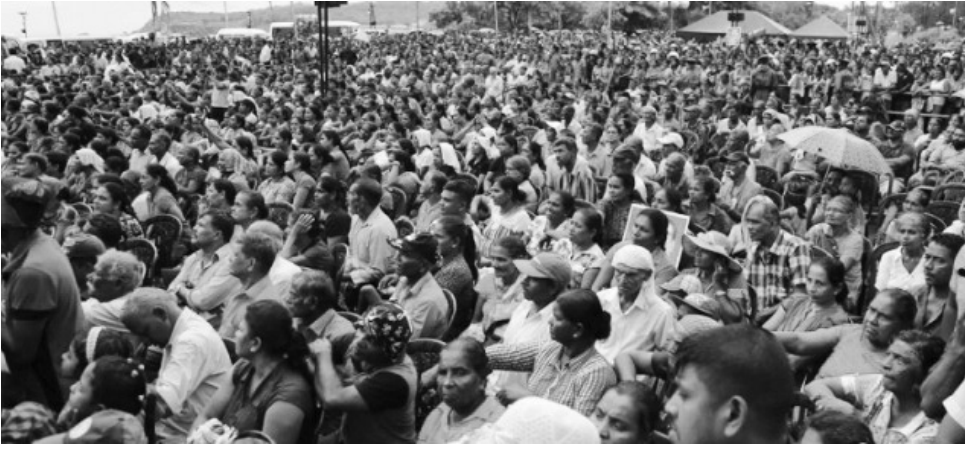
திருகோணமலையில் முன்னாள் ஜனாதிபதி மஹிந்த ராஜபக்ஷ கலந்து கொண்ட போராட்டம் நேற்று இடம்பெற்றது.