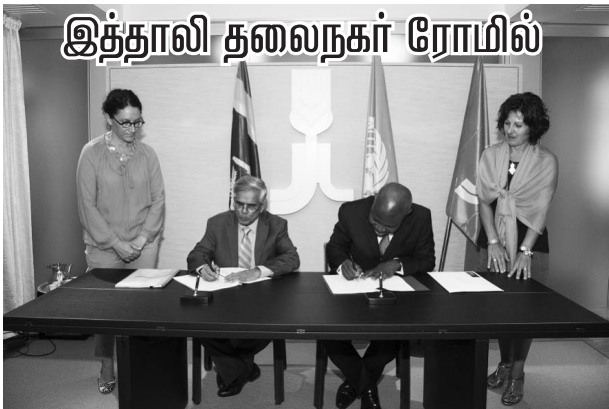
இத்தாலி தலைநகர் ரோமில்

இந்த வேலைத்திட்டம் அரசு, தனியார் மற்றும் பொதுமக்களின் பங்