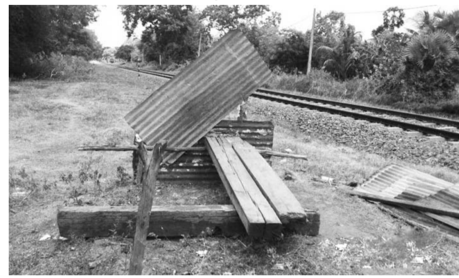
டில் சரிந்து வீழ்ந்துள்ளது. அததுடன் ரயில் கடவை பாதுகாப்புக்குப் போடப்பட்ட தடைகம்பியும் சேதமடைந்த நிலையில் காணப்படுகின்றது. எனவே, இதனையும் கருத்தில் கொண்டு அதைச் சீரமைத்து தர வேண்டும் என்று கோரிக்கை விடுத்துள்ளனர். (எ)

சேதமடைந்த நிலையில் பணியாளர் தங்கியிருக்கும் கொட்டில் விலகியுள்ளனர். அதையடுத்து சிறிது காலம் அந்தப்பகுதியில் பொலிஸார் கடமையில் இருந்தனர். தற்போது கடந்த சில தினங்களாக யாருமே கடமைக்கு வருவதில்லை. இதன் காரணமாக ரயில் கடவையைக் கடந்து செல்வதில் சிரமங்களை எதிர்கொள்ள வேண்டியதாக உள்ளது. இதனைக் கருத்தில் கொண்டு ரயில் கடவைக்கு பணியாளர் ஒருவரை நியமிக்க வேண்டும் என்று கோரிக்கை விடுக்கின்றோம். மேலும், தற்போது ரயில்கடவைபணியாளர் தங்கியிருக்கும் கொட்டில்