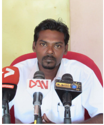
வவுனியா, ஜூலை 21 ரயில்கடவைக் காப்பாளர்களின் தொழில் உரிமைகள் மறுக்கப்படுகின்றன என்று வடக்கு, கிழக்கு ரயில்கடவைக் காப்பாளர்

ரயில் கடவைக் காப்பாளர் ஒன்றியத் தலைவர் விசனம்