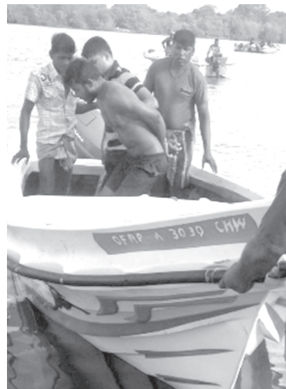
விசாரணைகளை முன்னெடுத்து வருவதாகத் தெரிவித்துள்ளனர். (உ)

இந்த நிலையில் தாக்குதலை மேற்கொண்ட நபர் கடல் வழியாக தப்பிச் செல்ல முயற்சித்த வேளை பொலிஸார் மற்றுமொரு படகில் சென்று சந்தேகநபரைக் கைது செய்துள்ளதாக தெரிவிக்கப்படுகின்றது. இந்தச் சம்பவம் தொடர்பில் முல்லைத்தீவு பொலிஸார்