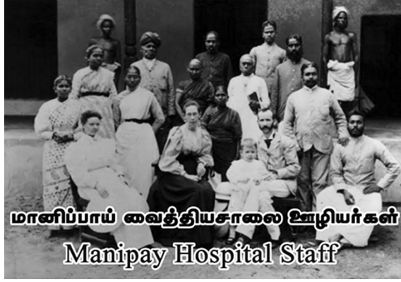
மானிப்பாய் வைத்தியசாலை ஊழியர்கள் Manipay Hospital Staff