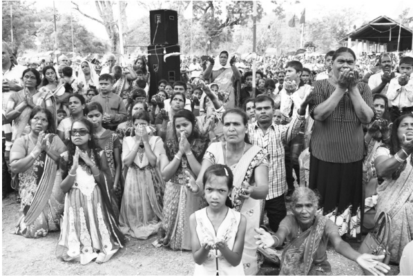
மன்னார் பெரியகட்டு புனித அந்தோனியார் ஆலயத்தில் நேற்று சிறப்பு திருப்பலி நிகழ்வு நடைபெற்றது.