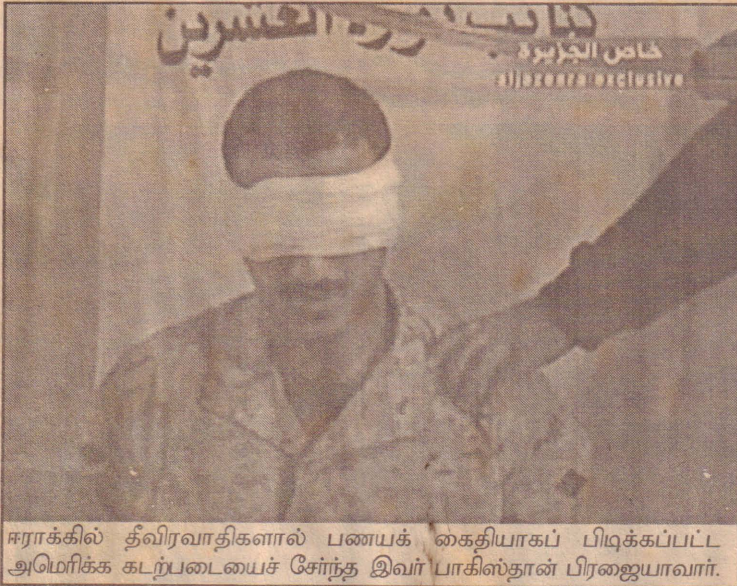
ஈராக்கில் தீவிரவாதிகளால் பணயக் கைதியாகப் பிடிக்கப்பட்ட அமெரிக்க கடற்படையைச் சேர்ந்த இவர் பாகிஸ்தான் பிரஜையாவார்.

இதேவேளை ஈராக்கில் விடயத்தில் அமெரிக்கா தனது கொள்கையினை மாற்றிக் கொள்ளவில்லை என்பதனைக் கண்டித்து அமெரிக்க வீரரை கொன்றுள்ளதாக தீவிரவாதிகள் அறிவித்துள்ளனர்.