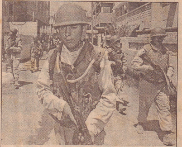
பாக்தாத் சந்தைப்பகுதியில் இணைந்துகாவல் பணியில் ஈடுபட்டுள்ள அமெரிக்கப் படையினரும் ஈராக்கிய பொலிசாரும்