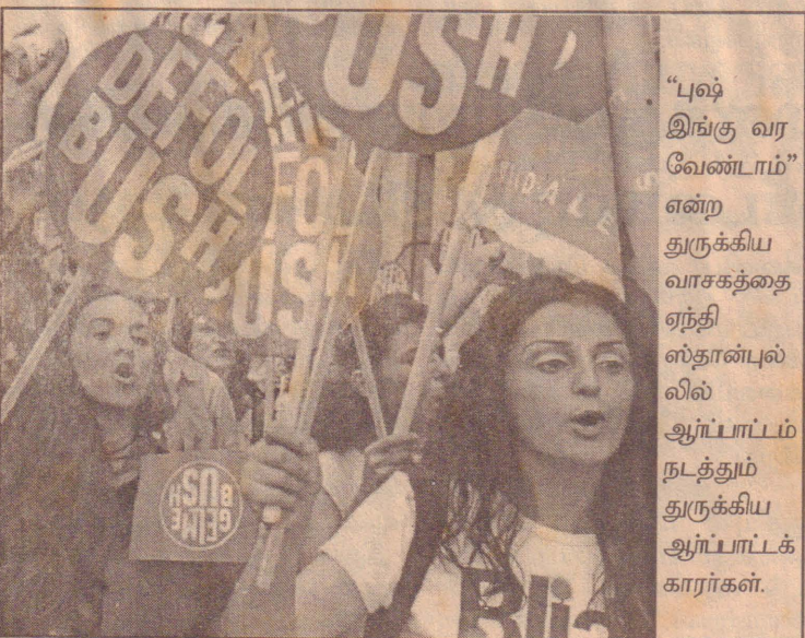
“புஷ் இங்கு வர வேண்டாம்” என்ற துருக்கிய வாசகத்தை ஏந்தி ஸ்தான்புல்லில் ஆர்ப்பாட்டம் நடத்தும் துருக்கிய ஆர்ப்பாட்டக் காரர்கள்.

உறவுகளை மேற்கொள்வதாக அமெரிக்க சனாதிபதி ஜோர்ஜ் டபிள்யூ புஷ் கூறியுள்ளார்.