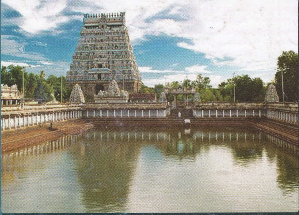
சிதம்பரம் தீர்த்தத் தடாகம்