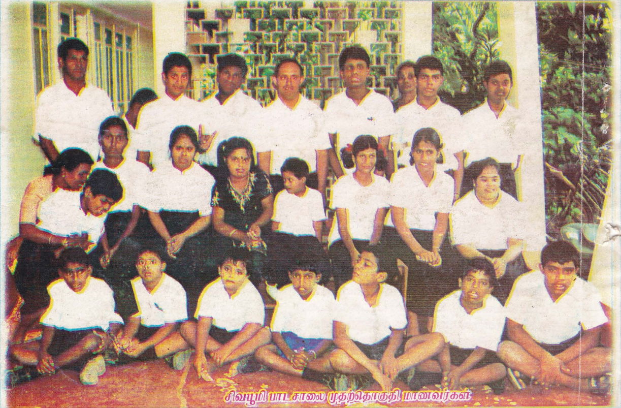
சிவ்ழி பாடசாலை முதற்கிரகி, மாவவர்கள்

அட்வைப்பதிப்பு : விள்ளையார் அச்சகம், 876, பருத்திக்குறை வீதி, நல்லூர், யாழ்ப்பாணம்.