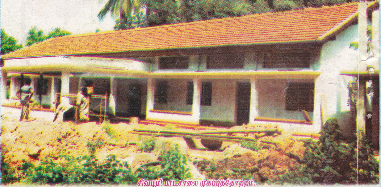
சிவ்ழி பாடசாலை முகப்புத்தோற்றம்.

அன்னை சிவதமிழ்ச்சல்வியினால் 02-07-2004இல் திறந்து வைக்கப்பட்ட சிவ்ழி பாடசாலை.