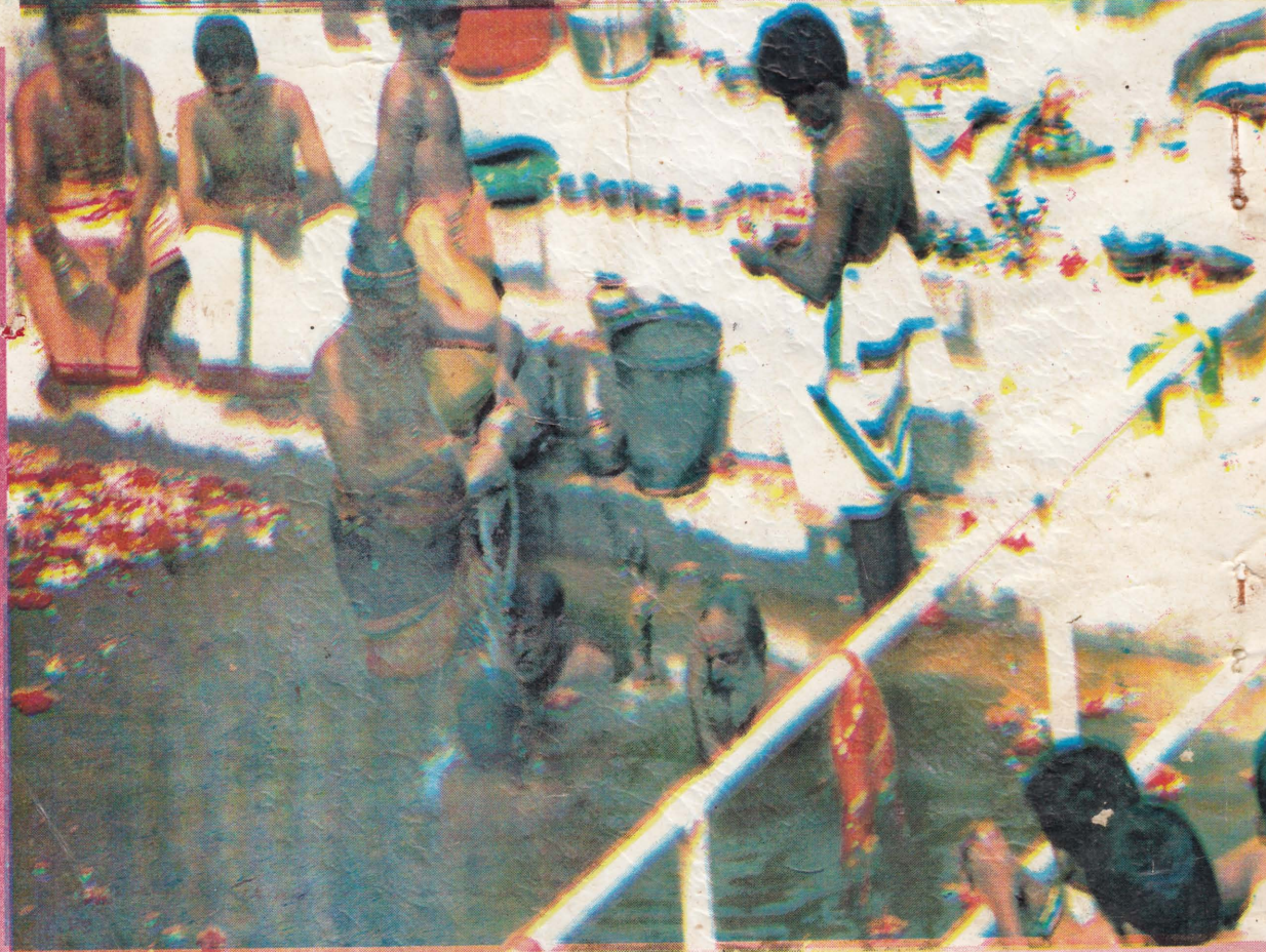
அட்டைப்பதிப்பு : பிள்ளையார் நேரக்கம்ப பதிப்பகம் நல்லூர்.