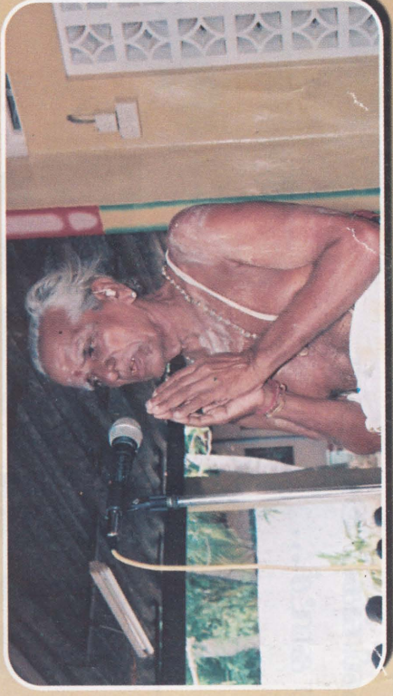
மாவிட்டமும் கந்தசாமி கோவில் ஆதீன கர்த்தா மகராஜமூர் து.சண்முகநாதக் குருக்கள் ஆசியுரை வழங்கும் காட்சி...