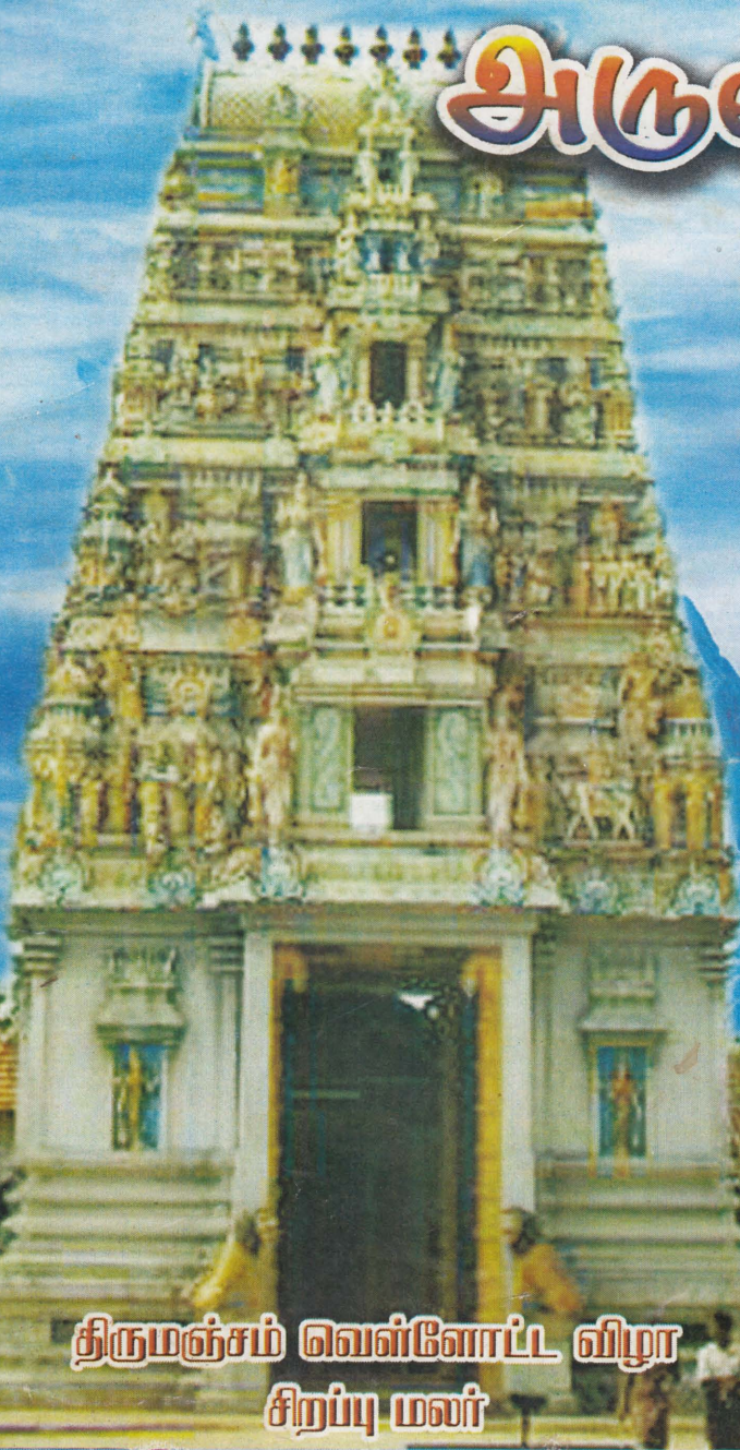
திருமஞ்சம் வெள்ளோட்ட விழா சிறப்பு மலர்