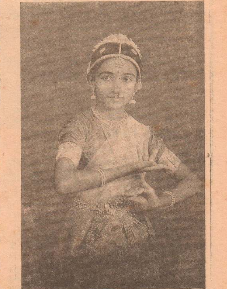
சென்னை ஜெயசெனி நடுவெந்திரனின் பரத நாடக அறிவுரை... - ஜார்ஜ் ரெல்