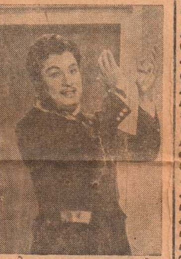
கூறியதாவது: காமராஜர் கூறுகிறார் ஜனநாயகத்தை காப்போம் என்று. அவருடன் சேர்ந்து கொண்டு ராஜாஜியும் கூறுகிறார். அதைப்போதானே நடிக்கிறேன் என்று கூறிவருகிறார்.

எம். ஜி. ஆர் போட்டியிடும் பரங்கிமலை தொகுதியில் நேற்று முதல் அமைச்சர் கருணாநிதி தேர்தல் பிரசாரம் செய்தார். அங்கு நடந்த கூட்டத்தில் முதல் அமைச்சர் பேசும் போது