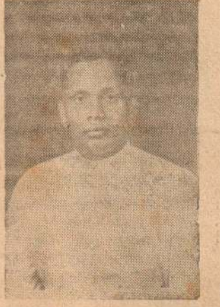
புழப்பாண மேற்றிராணியாக பணியாற்றிய இவரின் புகழ்பெற்ற பணியை நினைவுகூர்ந்து இவ்வாறு பரிபாலகர் பதவியை வழங்கியுள்ளோம்.

விவானுகூண்டாரத்தை இயற்றினார். சேர்த்தார் என்ற செய்தி மேலே குறிப்பிட்டுள்ளோம். இவரின் பணியில் மிகுந்த சிறப்பை சாதித்துள்ளார். இவர் தமது பணியில் மிகுந்த சிறப்பை சாதித்துள்ளார்.