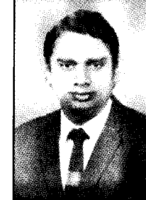
இளம் உதவி விரிவுரையாளர்