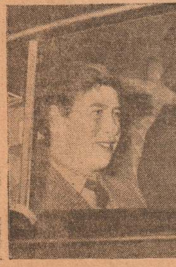
“அப்பெண்டிசைட்டிஷன்” என்னும் விழிப்புணர்வு சந்திர சிகிச்சை செய்யப்பட்ட சார்ள்ஸ் இளவரசர் ஆஸ்பத்திரியிலிருந்து அரண்மனைக்குச் செல்கையில் எடுத்தபடம் இது. பூரண குணமடைந்த இளவரசர் இப்பொழுது பாடசாலைக்குச் சென்று வருகிறார்.

திருவனந்தபுரம், மார்ச் 23 கேள்வி சட்டசபையில் விவசாய திருத்தமசோதாவும் ஸ்தலஸ்தாபன திருத்தமசோதாவும் நேற்று நிறைவேற்றின. விவசாய திருத்த மசோதா