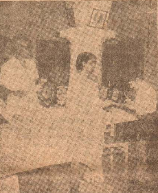
எடமாரை ஆசிரியர் சகிமை வருடந்தொழும் நடாத்தும் ஆக்கி, தமிழ்ப் பேச்சு, இசைப் போட்டியின் கீழ்ப்பிரிவு ஆண்டி ஆக்கி வெள்கப் போட்டியிற் முதலிடம் பெற்ற சரிமேவரை அகிலமே வரை! சாரம்மனர்-தமிழ் ஈரிடும் உயர்நெறி நீதிப்பிற் சொல்லும் செயலும் வளத்துணிவு-உணர்ந்த சொந்த உடமைபெயர் நெண்ணியுயர்

நானித் தலைமே நீதரண்டா-தம்பி நகிலுரம் சொன்னு வளர்ந்திருவாய் ஏழையாய் சொந்த மடிந்திருவாய்-சென்ற கோழையாய் மட்டுமீந் வாழாதே!